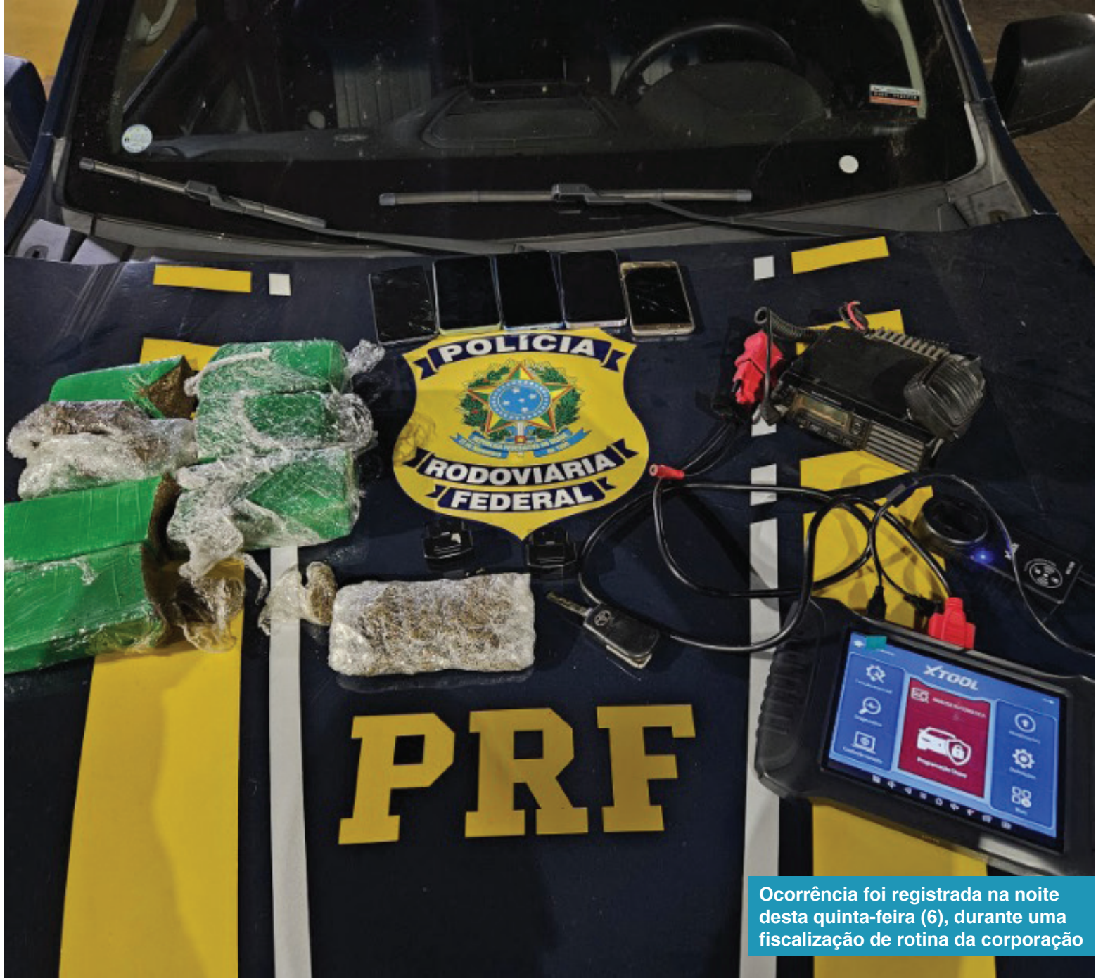
Ocorrência foi registrada na noite desta quinta-feira (6), durante uma fiscalização de rotina da corporação